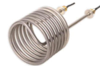
Widerstandsheizkörper aus hochkorrosionsbeständiger Legierung