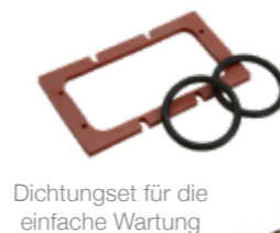
Dichtungset für die einfache Wartung