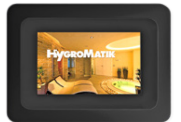
Spa Touch Control