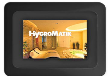
Spa Touch Control