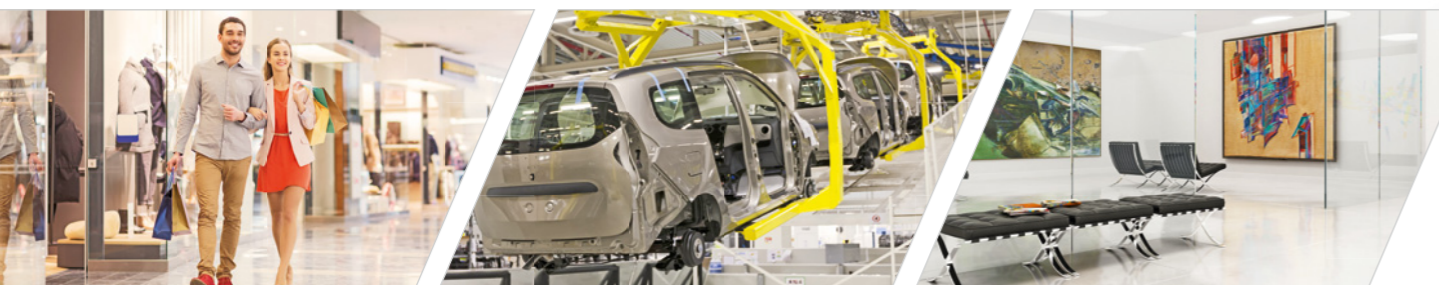
Einkaufszentren und Kaufhäuser