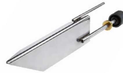
Auswechselbare Edelstahl-Großflächenelektroden für verschiedene Leitfähigkeiten