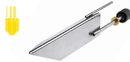
Auswechselbare Edelstahl-Großflächenelektroden für verschiedene Leitfähigkeiten

Die FlexLine Dampfgeneratoren sind in der Elektroden- als auch Heizkörpervariante erhältlich – je nachdem, welche Wasserqualität vorliegt und wie hoch die Anforderungen an die Regelgenauigkeit sind.