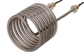
Widerstandsheizkörper aus hochkorrosionsbeständiger Legierung