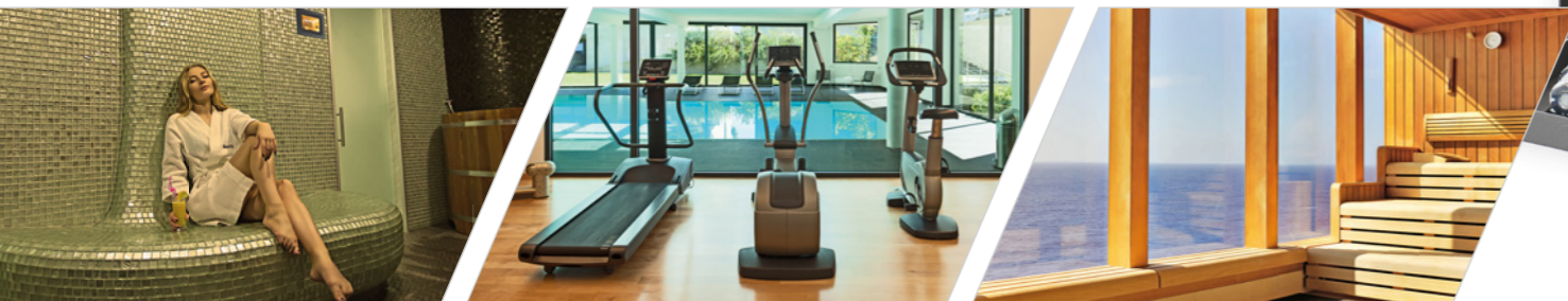
Spa Resort und Wellnesshotel

Das jeweilige Grundmodell der FlexLine ist in seinem Aufbau die Basis für alle weiteren Konfigurationsmöglichkeiten. Durch ihre individuelle Ausstattung lässt sich die FlexLine an den Bedarf der unterschiedlichen Anwendungen im SPA- und Wellnessbereich anpassen.