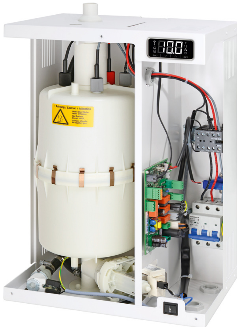
Abbildung StandardLine Elektrode